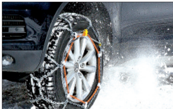
Spezielle Schneeketten für Ihr Fahrzeug.

Wer bei winterlichen Straßenverhältnissen mit untauglicher Ausrüstung unterwegs ist, riskiert nicht nur seine Sicherheit, sondern muss auch mit teilweise saftigen Bußgeldern rechnen. Was in Deutschland mit der »situativen Winterreifenpflicht« noch relativ harmlos erscheinen mag, kann in den Alpenländern, wo es viel häufiger zu extremen winterlichen Straßenbedingungen kommt, schnell gefährlich und teuer werden. Nicht nur aus finanziellen Gründen, sondern vor allem aus Gründen der Sicherheit sollte man sein Geld lieber in einen Satz moderner Schneeketten investieren. Denn auf langen und steilen